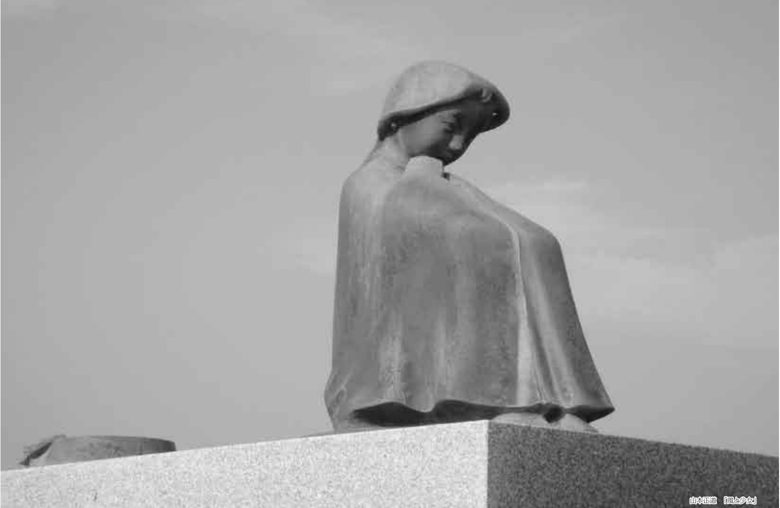
山本正道 「風と少女」